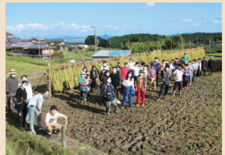
9/20 龍谷大学農学部食料農業システム学科 (大津市) × 百済寺ブランド認証協議会 (東近江市)